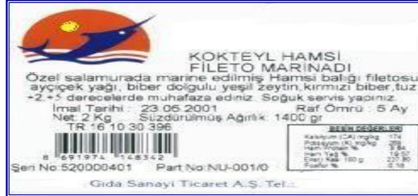
Bir gıda maddesinin etiketi

Gıda maddesinin bileşiminde tatlandırıcı var ise “içinde Tatlandırıcı Vardır” ifadesi, gıda maddesine %10 veya daha fazla poliol eklenmiş ise “Aşırı Tüketimi Laksatif Etkiye Neden Olabilir” ifadesi yer almalıdır.