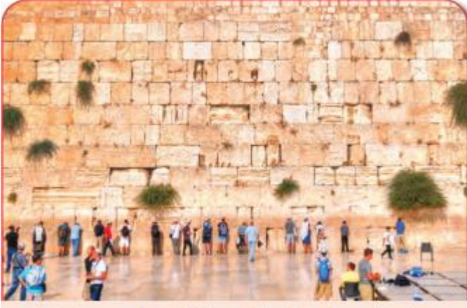
5.2. Süleyman Mabedi'nden günümüze ulaşan batı duvarı (Ağlama Duvarı) Yahudiler için çok önemlidir.