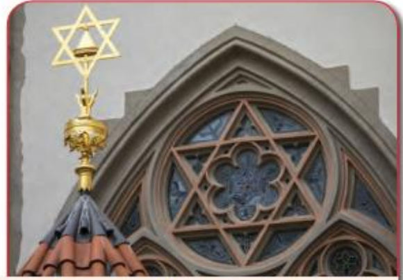
5.3. Yedi kollu şamdan ve Kral Davut'un mührü, Yahudiliğin önemli sembollerindedir.